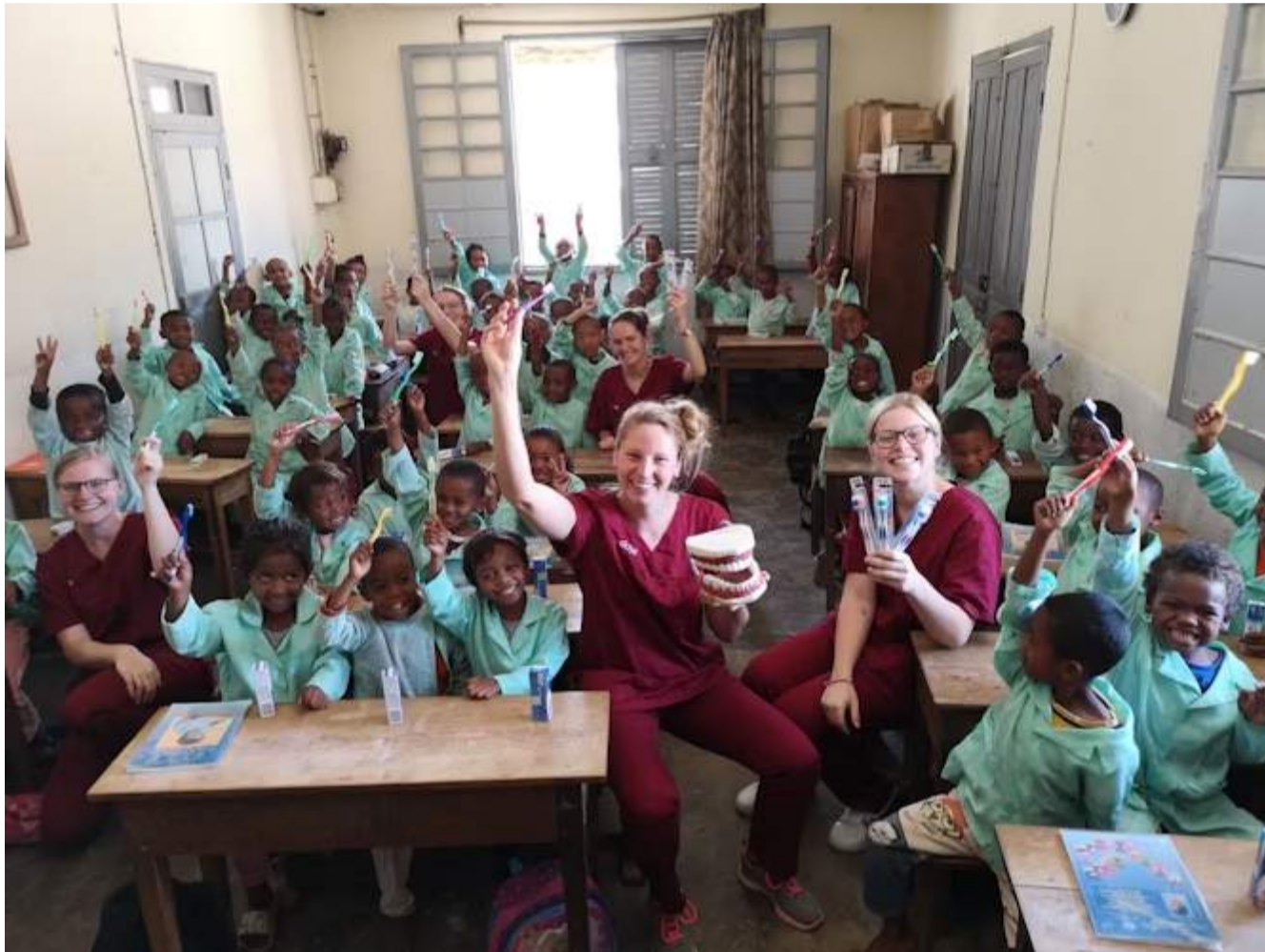
Gute Vorsorge: Neben den eigentlichen Behandlungen stellt das Team bei seinen Einsätzen auch sicher, dass die nachfolgende Generation sowohl aufgeklärt als auch mit geeigneten Putzutensilien richtig ausgerüstet wird.